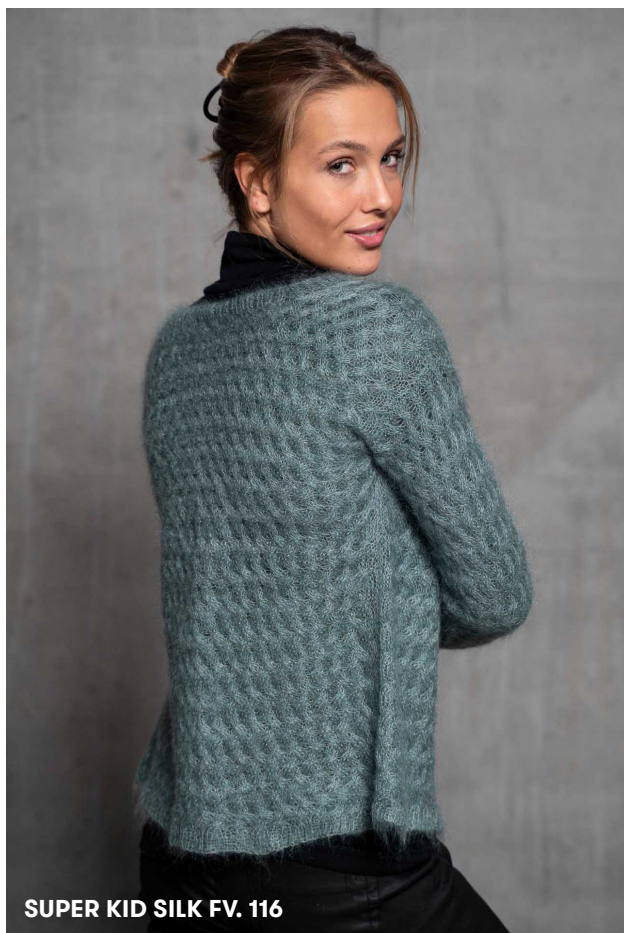
SUPER KID SILK FV. 116

5: Vask nænsomt efter anvisningen, træk forsigtigt i facon, og lad din cardigan liggetørre.